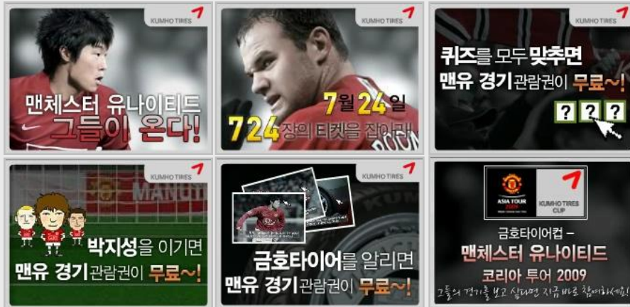
[ 배너 크리에이티브 ]