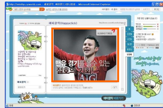
싸이월드 - 해피클릭 상단 확장형