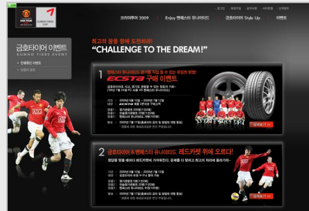
[ 이벤트 페이지 ]