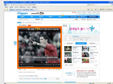
엠군 - 뷰페이지 플레이어스킨