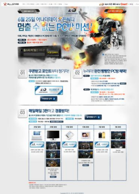
[ OBТ 이벤트 페이지 ]

- 이벤트 메인 페이지 방문시 오픈 축하 이벤트와 PC방 이벤트 페이지를 각각 선택하여 방문 가능