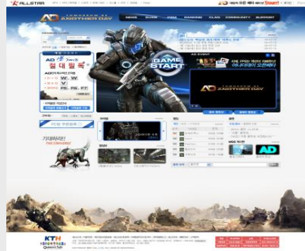
[ Pre OBТ 이벤트 페이지 ]

- 어나더데이 홈페이지 방문후 게임 정보 확인 및 닉네임 등록 등 게임 참여 유도를 위한 이벤트를 참여한 자에게 경품 증정