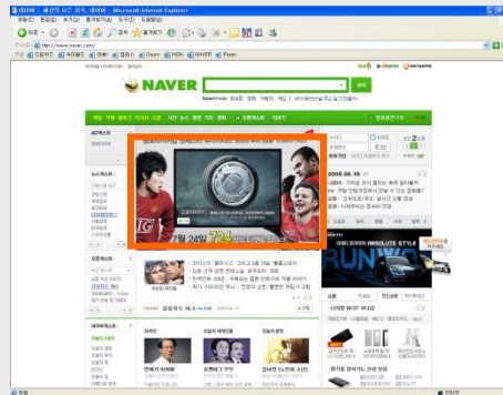
네이버 - 메인 동영상 확장형