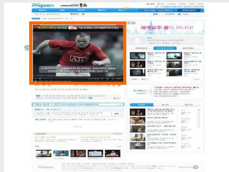
엠군 - 플레이어 Pre CM