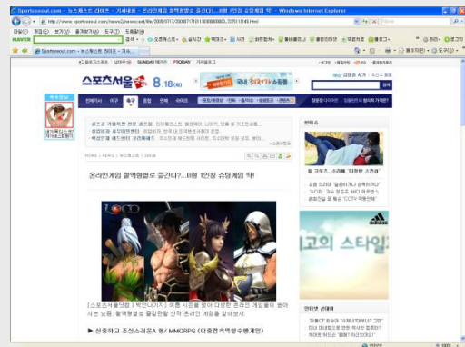
[네이버 뉴스캐스트 집행 - 전자신문 / 스포츠서울]

언론사와 협의하여 네이버 뉴스캐스트 영역에 일정 시간 동안 어나더데이 관련 보도 자료 고정 노출