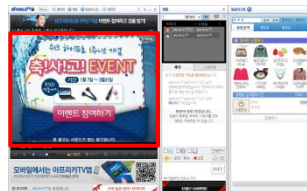
■ 아프리카 프리롤