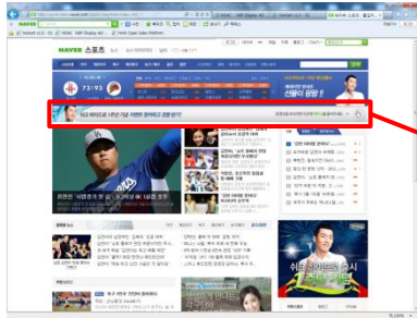
■ 네이버 스포츠 트리플플레이