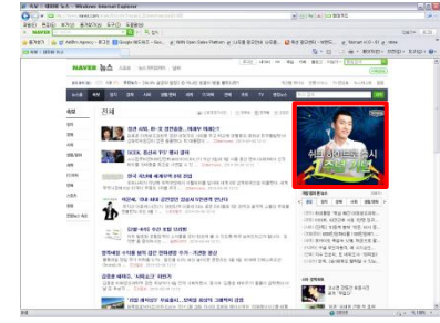
■ 네이버 뉴스면 우측배너