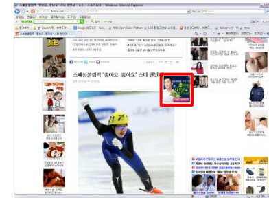
■ 언론사 기사 이미지 위 노출 배너

- 기사내 이미지 위에 소재 노출되어 즉각적인 주목도와 우수한 반응을 보임