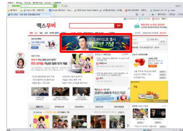
■ 맥스무비 초기면 빅배너