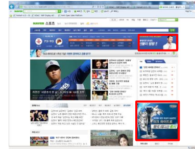
■ 네이버 스포츠 트리플플레이 스크어보드 내 배너